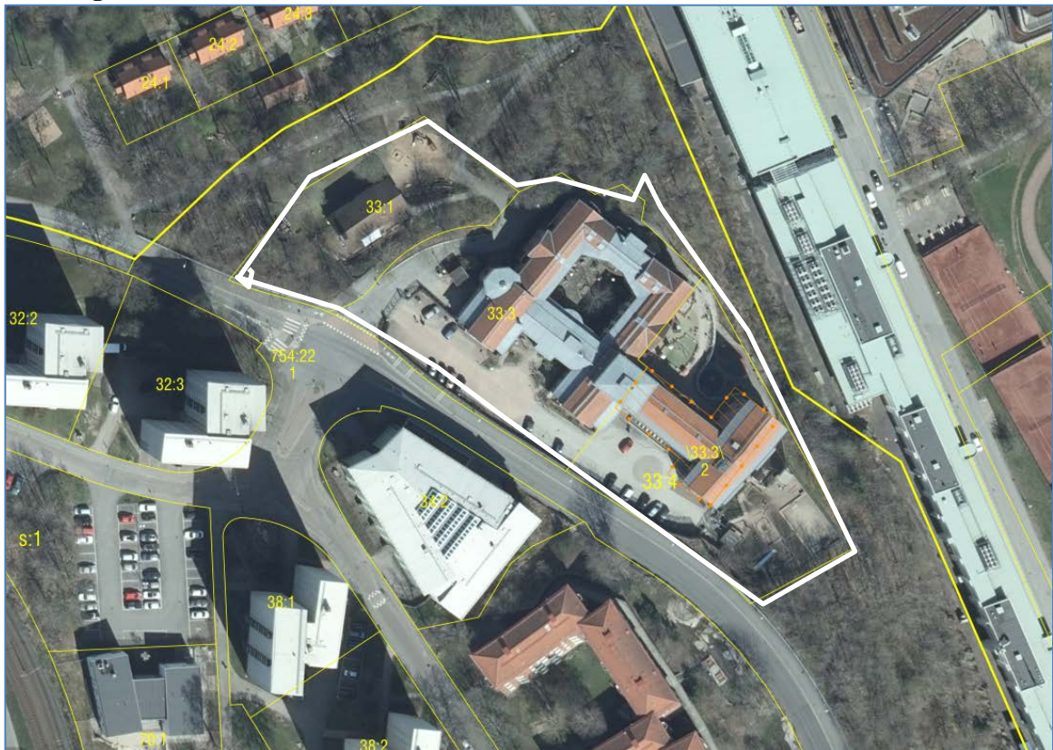
Figur 1 Lokalisering av fastigheten Guldheden 33:1-4.

Det pågår en detaljplaneprocess av fastigheten Guldheden 33:3 där det tidigare funnits en bensin-station. Idag finns det bl a ett äldreboende och en förskola. Jahja Zeqiraj, biträdande projektchef, Neuberghska Stiftelsen har därför inom ramen för pågående detaljplaneprocess gett Relement Miljö Väst AB i uppdrag att genomföra en historisk inventering av fastigheten och med underlag av den bedöma sannolikheten för att marken är förorenad. Uppdraget utgör underlag till beslut om några ytterligare undersökningar är nödvändiga i ett senare skede. Fastighetens läge visas i figur 1 .