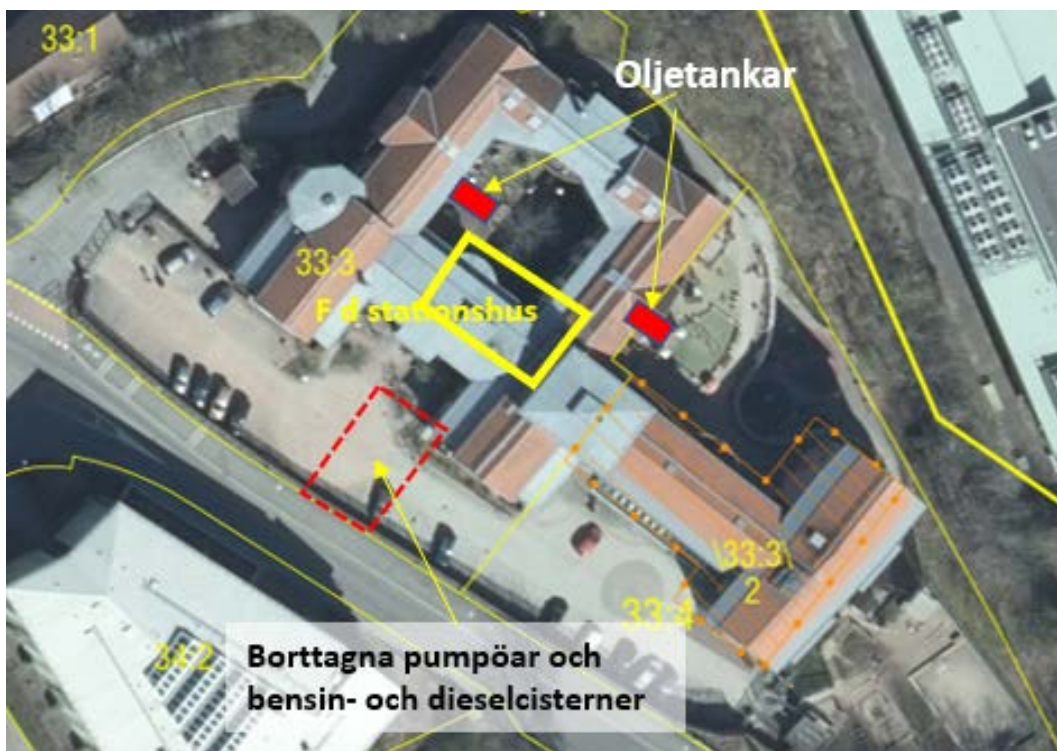
Figur 1 Lokalisering av f d bensinstationsanläggning.

I början av 1990-talet byggdes nuvarande äldreboende och förskola på aktuell fastighet. Stationsbyggnaden revs och sannolikt tog man även upp kvarlämnade oljetankar i mark eftersom nya byggnader grundlades på marken.